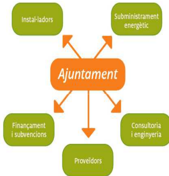
Agents involucrats en la gestió energètica municipal sense un contracte MESE